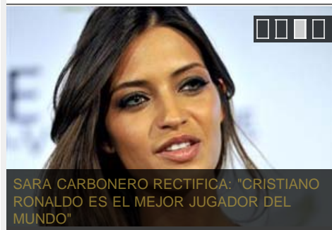
SARA CARBONERO RECTIFICA: "CRISTIANO RONALDO ES EL MEJOR JUGADOR DEL MUNDO"