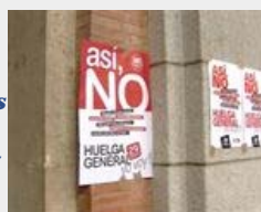
UGT ve "natural" que los empresarios quieran abrir el día de la huelga general