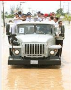
Clima.- El huracán 'Karl' deja 12 fallecidos y un millón de afectados en Veracruz