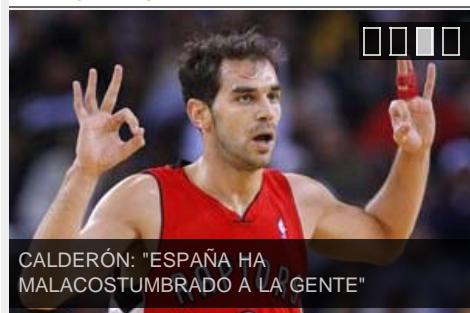
CALDERÓN: "ESPAÑA HA MALACOSTUMBRADO A LA GENTE"