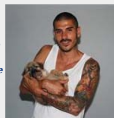
Personajes famosos y perros abandonados posan para la revista 'Cosmopolitan'

CHANCE > Gente | Belleza | Moda | El Buen Vivir | Ocio y Cultura | Viajes | Tendencias